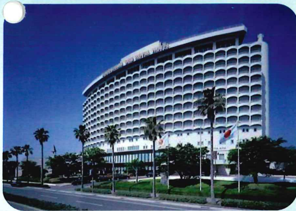
鹿児島サンロイヤルホテルの レストランでも使えます

おでかけ商品券は、本日ご宿泊の鹿児島サンロイヤルホテルでもお使いいただけます。 その場で寄附して、その場で使える「かごしまおでかけ商品券」をぜひご利用ください！