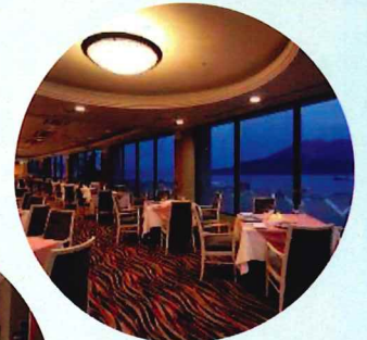
スカイラウンジ 「フェニックス」