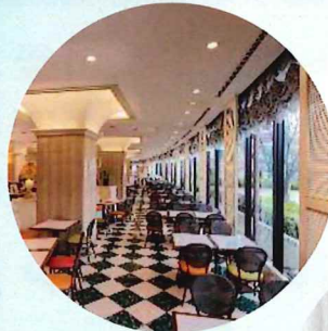
カフェレストラン 「トリアン」