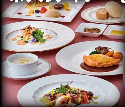
※料理の写真はイメージです。