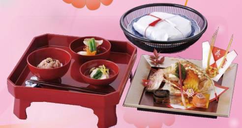
お食い初めセット 男の子用 (小鯛お頭付)