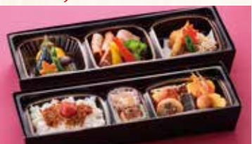
上段: 12×33×5cm 下段: 11×32×5cm