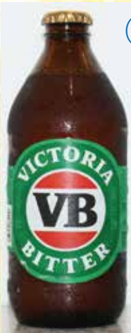
Victoria Bitter (ヴィクトリア・ビター)