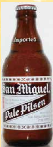
San Miguel (サンミゲール)

オーストラリア オーストラリアで、 絶大な人気を誇る ビール。 やわらかな味わい。