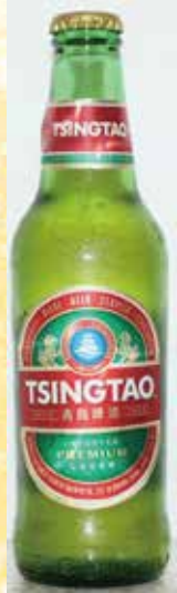
青島啤酒・青島啤酒 青島ビール (チンタオビール)