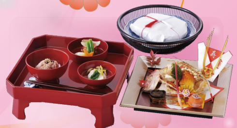
お食い初めセット 男の子用 (小鯛お頭付)