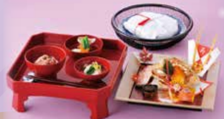
お食い初めセット 男の子用 (小鯛お頭付)