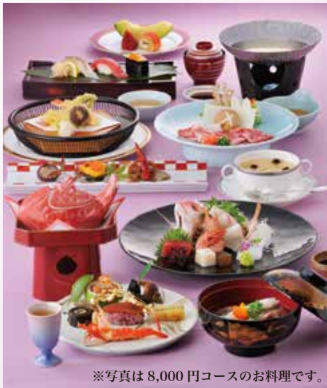
※写真は8,000円コースのお料理です。