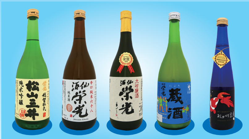
酒仙栄光 辛口純米六十八

新鮮な海山の幸や季節野菜を使い、趣向を凝らし涼感たっぷりに仕上げた爽やかな夏の会席をご用意いたします。